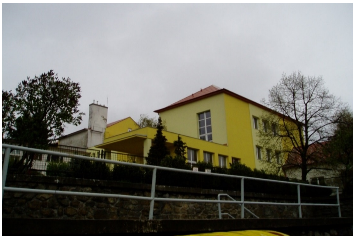
budova škola na Gorazdovej ul. 20 – súpisné číslo 3416